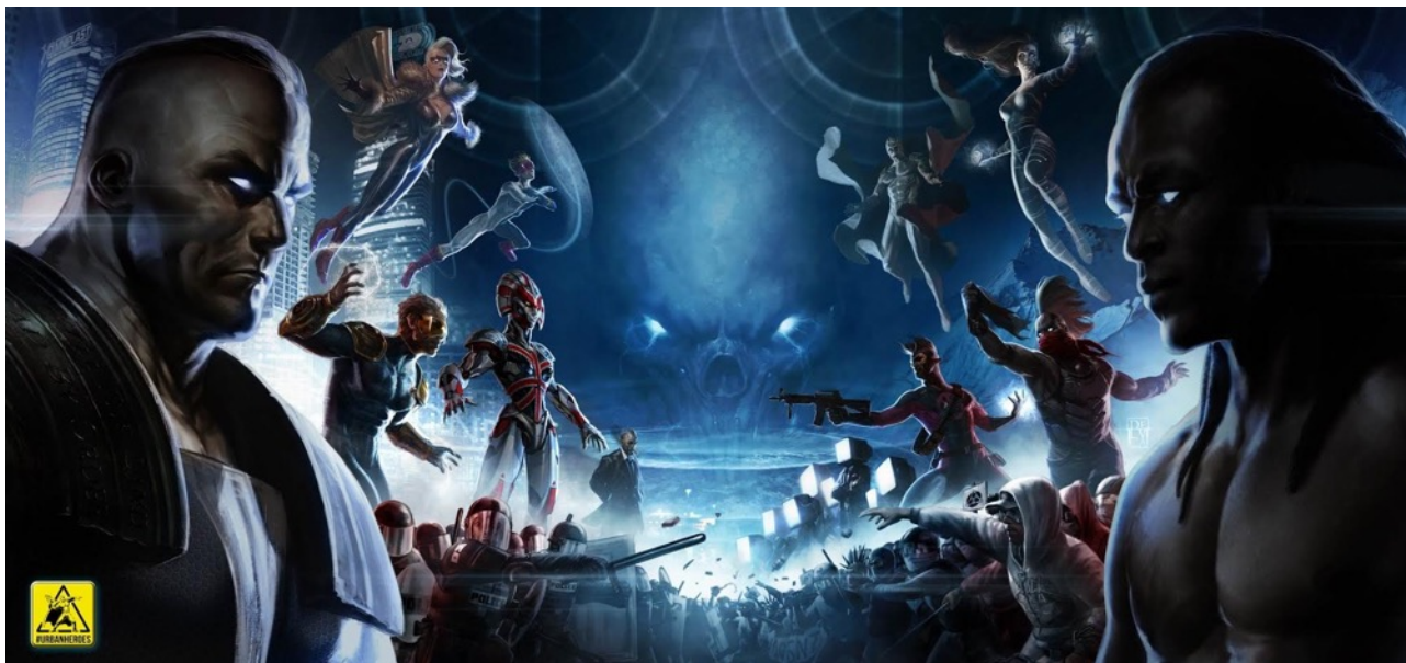
Schermo dello Sceneggiatore, illustrato da Antonio De Luca

Ecco un elenco delle uscite a disposizione: